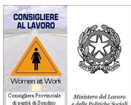
CONSIGLIERA DI PARITA'