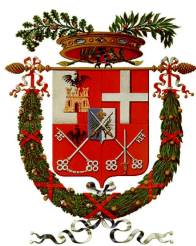
Provincia di Sondrio