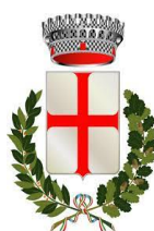
COMUNE DI CHIURO