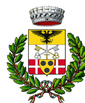
COMUNE DI TRESIVIO