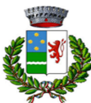
COMUNE DI PIATEDA